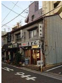
若鯨家の起源となった店